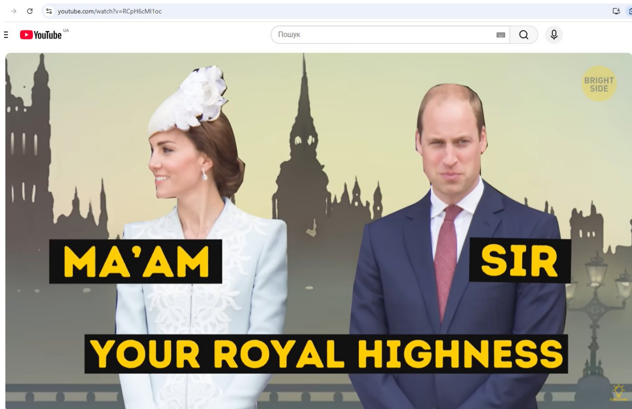
9 Things No One Can Do When Meeting the Queen

Рис.1 Скріншот відео 9 Things No One Can Do When Meeting the Queen