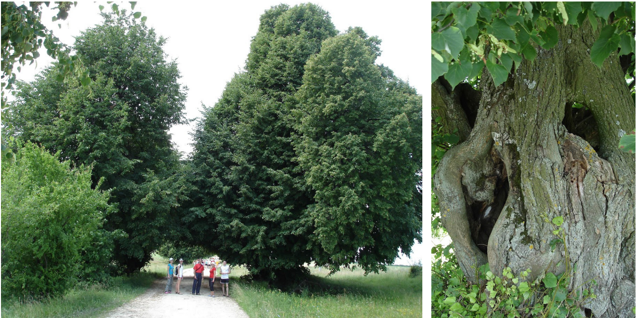
Рис. 2. Вікові липи «Липової алеї» від Носковець до хутора Демків

4. Селитебні ландшафти Носківці. Село Носківці, приваблює не лише природною красою, а й багатством історико-культурної спадщини. Це місце, де природа і минуле зустрічаються, надаючи йому унікаль-