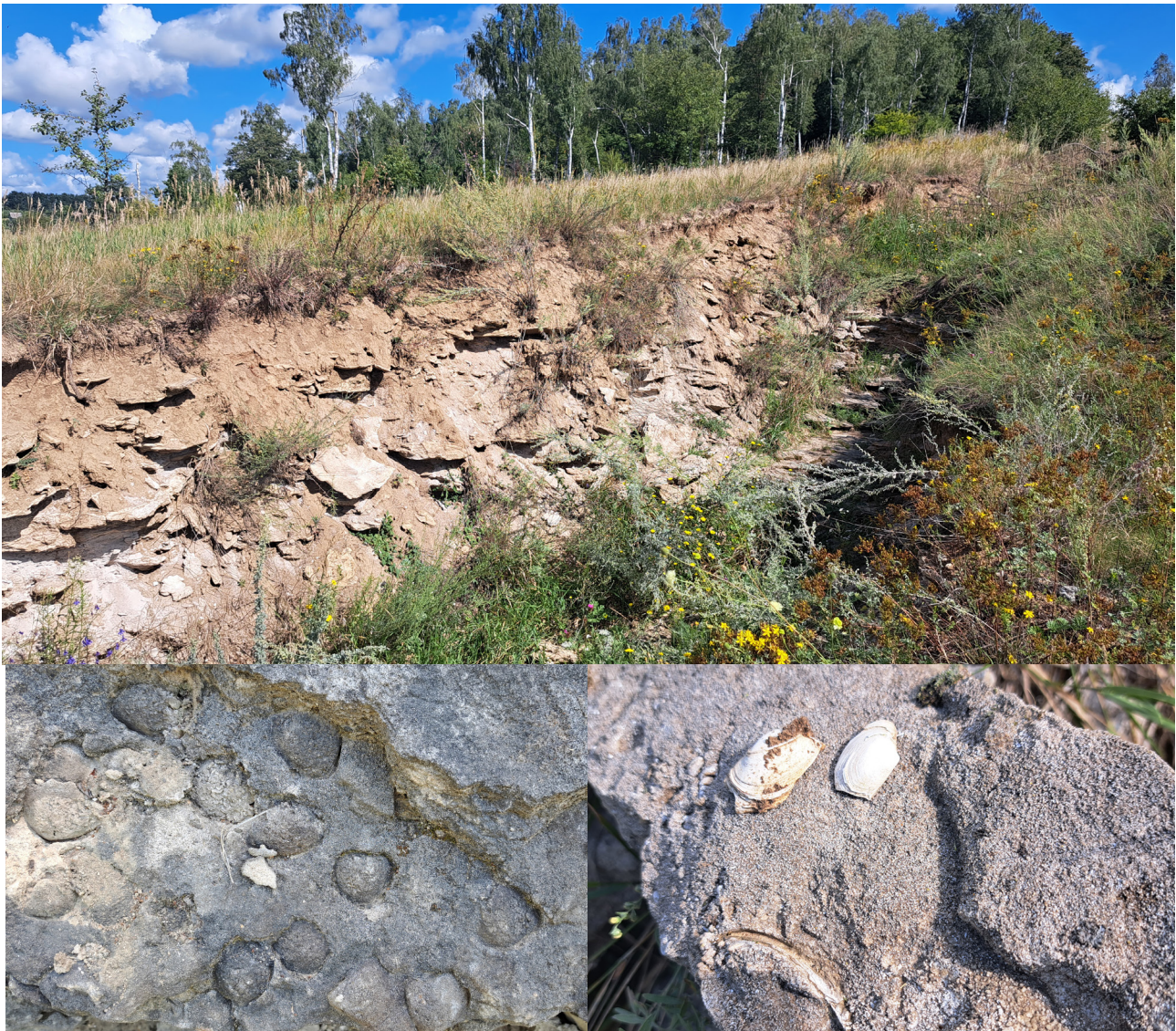
Рис. 6. Відклади Сарматського моря. Рівські Товтри

стовими воронками, тріщинами, місцями обвальними відшаруваннями. Значна карбонатність порід зумовлює багатство кальцієлюбної рослинності та формування специфічних фітоценозів, адаптованих до сухих і теплих умов на південних схилах. Таке поєднання геоморфологічних, літологічних і біотичних чинників визначає високу цінність Рівських Товтр з погляду ландшафтного різноманіття, можливостей для репрезентації рифогенних утворень сарматського періоду та збереження унікальних біоценозів, пов'язаних із карбонатними субстратами. З огляду на це,