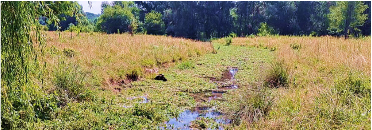
Рис. 4. Карстові джерела «Вусикові криниці»

альні об'єкти, що сприяло укріпленню матеріальної бази господарства. Воно стало одним із найрозвинутіших за рівнем забудови і благоустрою не лише в області, а й Україні. У цей період у селі збудовано чотири двоповерхові багатоквартирні будинки для працівників і службовців радгоспу, будинок культури, дитячий садок на 120 місць, середню школу, будівлю сільської ради, спальний корпус для піонерського табору, плодосховище на 2000 т, винний цех, реконструйовано будинок побутових послуг та кінотеатр. Зараз, на жаль, від попередніх досягнень не залишилися і сліду, лише покинуті будівлі.