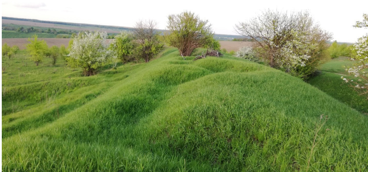
Рис. 5. Северинівське городище

родний перехід через Рів, підкреслюючи важливість розташування городища впродовж століть.