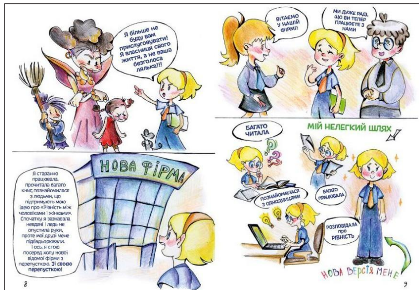
Рис. 1. Фрагменти творчого проекту «Я не Попелюшка»

використовують такі засоби проєктної діяльності: сервіс для створення зручної наочної легко керованої системи заохочення з різними ролями й рівнями доступу – ClassDojo ( https://www.classdojo.com/ ); сервіси для створення віртуальних екскурсій – «Google Culture Institute», «World Wonders Project», «Google Expeditions»; сервіс для створення скрайбінгу, скрайб-презентації, мультфільму – VideoScribe ( https://www.videoscribe.com/ ); сервіс для створення вікторин, тестів, флеш-картки з можливістю учнів обирати власну траєкторію навчання Quizizz ( https://quizizz.com/ ); сервіс для створення тестів, вікторин, вправ на встановлення відповідності, вправ на відновлення порядку, вправ на заповнення відсутніх слів, фрагментів тексту, кросвордів – LearningApps; сервіс для створення онлайн вікторин, тестів і опитування з прив'язкою до часових проміжків виконання завдань – Kahoot ( https://getkahoot.com/ ); сервіс для створення мультимедійних плакатів, електронних дидактичних матеріалів до уроку, карт подорожей, маршрутних карт, інтелектуальних плакатів – ThingLink ( https://www.thinglink.com/ ).