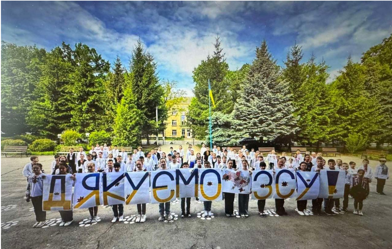
Рис. 1. Учні 3-4 класів Агрономіченського ліцею Агрономічної сільської ради

себе щасливими та захищеними. Ми дійшли висновку, що саме в такому середовищі педагоги та батьки повинні співпрацювати для надання найкращої допомоги один одному.