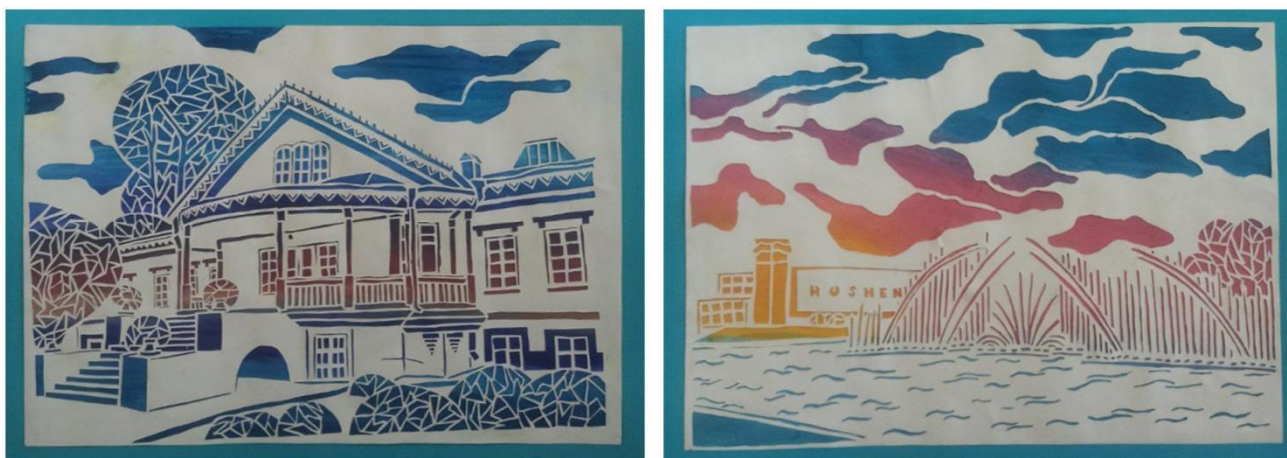
Рис. 2. Зразки творчих робіт проекту «Книга-витинанка «Серце Вінниці»»

«Серце України». Основна ідея проекту – познайомити здобувачів з техніками мистецтва витинанки, сформувати у них практичні навички сучасного оформлення творчої роботи, дати можливість отримати практичний досвід роботи над груповим проектом. Історичні будівлі та місця м. Вінниці стали образами унікальних авторських витинанок, зміст яких влучно доповнювали авторські вірші здобувачів (рис.2).