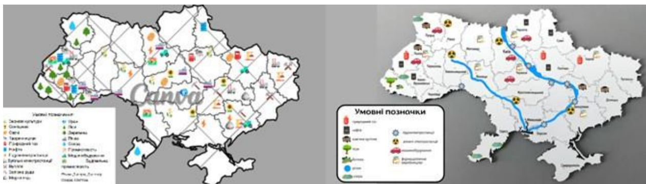
Рис. 3. Інтерактивна карта «Економічні ресурси України»

які використали студенти, є доступними для дітей дошкільного віку. До даної карти здобувачі вищої освіти розробили супровідну бесіду для дітей старшого дошкільного віку.