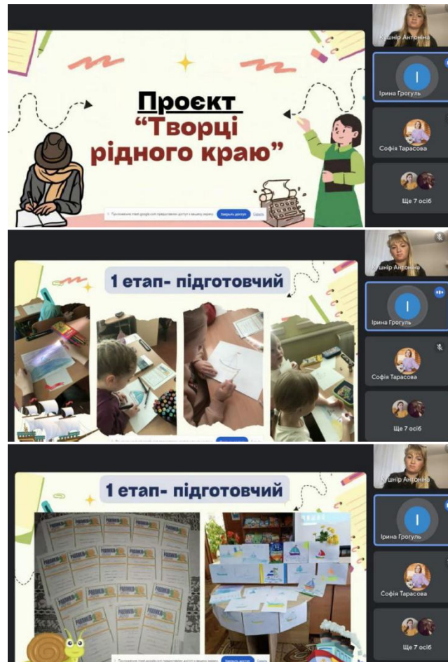
Рис. 3. Фрагменти творчого проекту «Творці рідного краю»

враховувати педагогу в процесі роботи над проектом, способи включення проектної діяльності в освітній процес початкової школи.