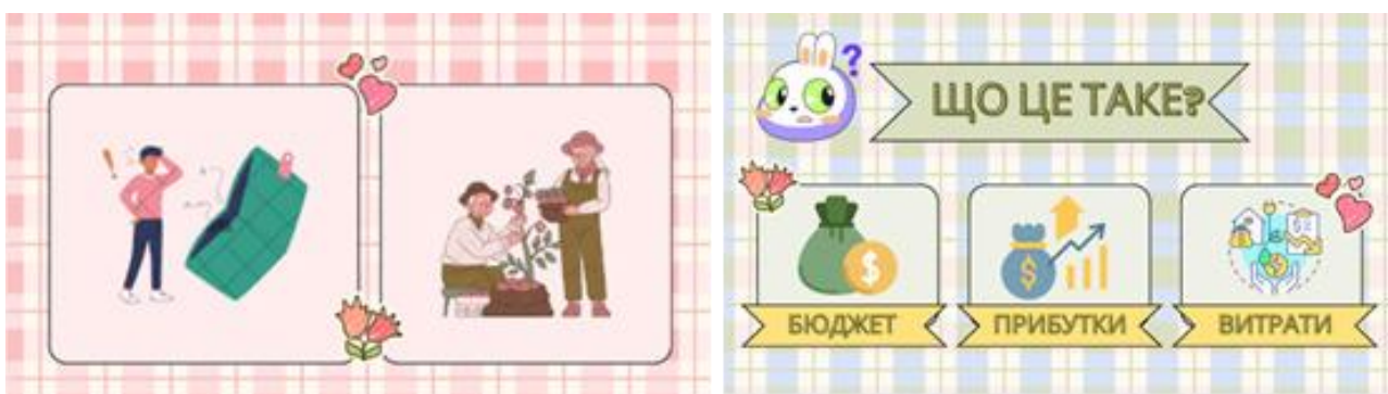
Рис. 4. Завдання до вікторини

Однією з тем, з якою ознайомлюють дітей дошкільного віку, є реклама. Важливо навчити дітей розуміти призначення реклами, кри-