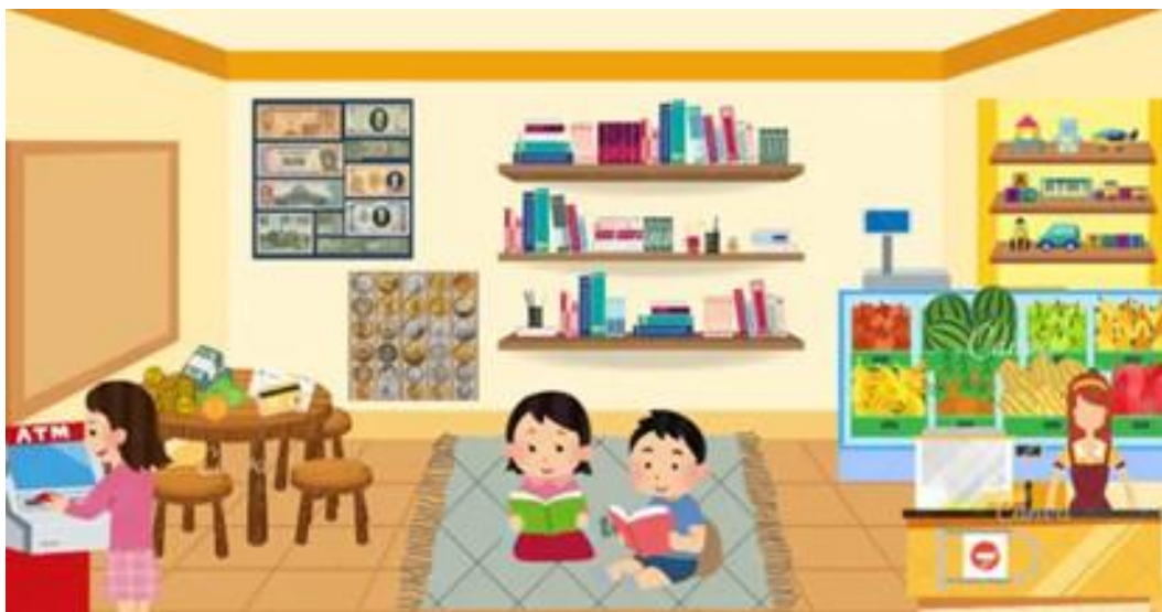
Рис. 1. Макет предметно-ігрового розвивального середовища (осередок економіки)

Під час вивчення навчальної дисципліни здобувачі вищої освіти набувають практичних умінь у доборі, конструюванні та розробці інноваційних методів формування основ фінансово-економічної грамотності дошкільників. Розглянемо приклади практичних завдань, у процесі виконання яких здобувачі вищої освіти набувають означені знання, уміння та навички. Так, у процесі ознайомлення з темою «Засоби формування основ фінансово-економічної грамотності» студенти за допомогою застосунку «Canva» створюють макет предметно-ігрового розвивального середовища, зокрема осередок з економічного виховання (рис. 1), добирають науково-популярну, художню літературу для