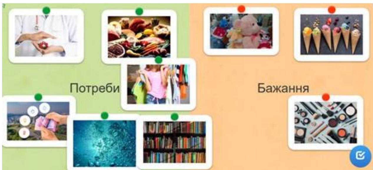
Рис. 2. Дидактична гра «Потреби і бажання»

Діти управляють власним кафе, де вони повинні обслуговувати клієнтів, приготувати