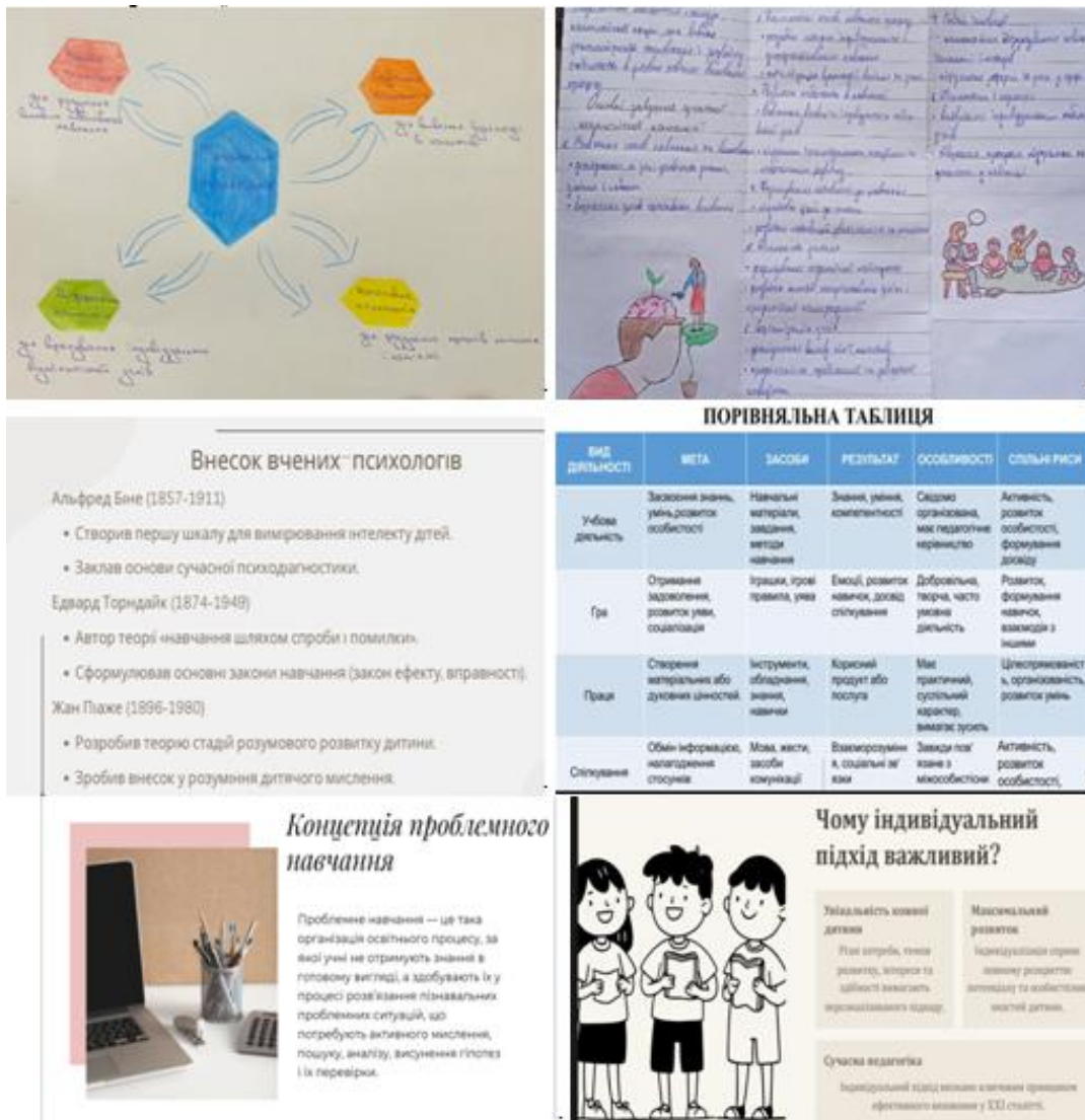
Рис. 1. Фрагменти творчих робіт здобувачів вищої освіти

характеристики професії «учитель» [1, с. 46].